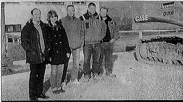
Le maire et ses conseillers sont satisfaits de voir aboutir ce projet