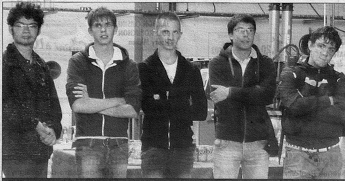
Un bateau construit par plusieurs des jeunes qui embarquent la semaine prochaine

« Je suis heureux de voir l'aboutissement de ce projet d'envergure qui donne du sens à l'enseignement. Au-delà d'une belle aventure, il s'agit aussi de relancer une filière (structure métallique) où les candidats sont peu nombreux. Cette opération a permis d'en redorer le blason auprès d'élèves inscrits à l'origine en BEP, aujourd'hui en Ire ou terminale STI, et dont certains envisagent désormais de poursuivre en BTS construction et réalisation de chaudronnerie industrielle. »