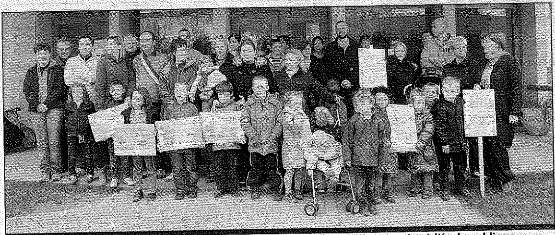
Les élus ont exprimé à travers la présente motion leur attachement et leur soutien à l'école publique

service public de l'éducation. Afin d'encourager les communes à replanter des haies cauchoises et encourager les habitants à créer ou renouveler les haies traditionnelles, le CAUE propose la signature d'une convention permettant l'octroi de subventions pour la commune et pour les particuliers. Par ailleurs, pour inciter les agriculteurs à adopter cette solution d'hydraulique douce, il est proposé l'octroi d'une participation communale de 8 euros le mètre linéaire pour la réalisation de fascines vivantes.