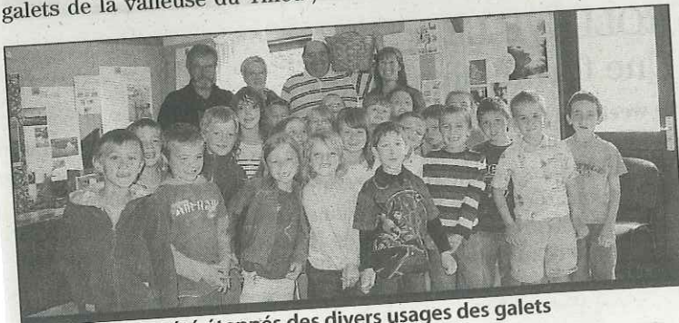
Les enfants ont été étonnés des divers usages des galets

fallait trier les galets, les plus petits étaient passés au crible, ne ramasser que les ronds, sans trou, pas les noirs, ni transparents car trop tendres. Les galets étaient mis dans des paniers (35 kg) qu'ils vidaient ensuite dans des sacs transportés par des mulets. Mais quand il ne fut plus possible aux bêtes d'accéder dans la valleuse, les ramasseurs portaient eux-mêmes les sacs (50 kg) sur leur dos. Ils étaient payés au rendement. Réputés pour leur dureté, les galets étaient expédiés au Japon, en Amérique. Ils servaient au broyage, étaient utilisés aussi dans les produits de beauté, le dentifrice, l'industrie pharmaceutique, les filtres.