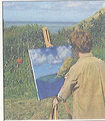
Les rues de la commune s'ouvrent aux artistes locaux

Quant aux Brunevalais, ils ouvrent leurs jardins aux artistes en tout genre (peintres, sculpteurs, photographes...). Un jardin accueille les travaux des élèves de l'école. Une trentaine d'artistes seront accueillis dans les jardins et la rue principale, de 10 à 18 heures.