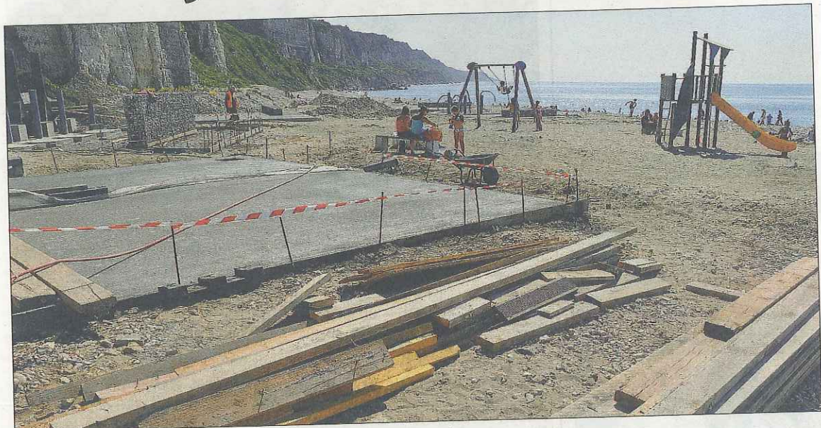
Le chantier en cours et, au second plan, les jeux et la plage de galets

Si le maire François Auber se rendra bientôt sur place pour superviser l'avancée des travaux de la nouvelle plage de Saint-Jouin-Bruneval, le grand beau temps des derniers jours a fait venir les amoureux du coin et du bronzage.