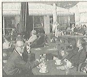
« La Frite d'Or » devra déplacer sa plate-forme (photo d'archive)

cière auprès de la commune. Cette année, les conditions financières feront l'objet d'une modification de base de calcul. C'est le cas de la convention plate-forme terrasse n°1 de Saint-Jouin