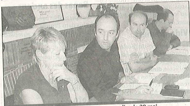
La 4e édition de « la valleuse des Arts » aura lieu le 20 mai

La situation de crise que traverse la presse quotidienne régionale a été évoquée. « Si ces titres, Havre Libre , Le Havre Presse , Le Progrès , Paris Normandie , venaient à disparaître, ce serait un morceau de démocratie qui s'évanouirait avec eux, selon les élus, partisans d'une pluralité de l'information accessible à tous. La vie économique, sociale et politique perdrait là un véritable et nécessaire espace d'expression. » Face à cette situation dommageable, le conseil approuve la motion à l'unanimité.