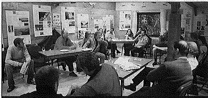
Les participants se sont réjouis de cette initiative