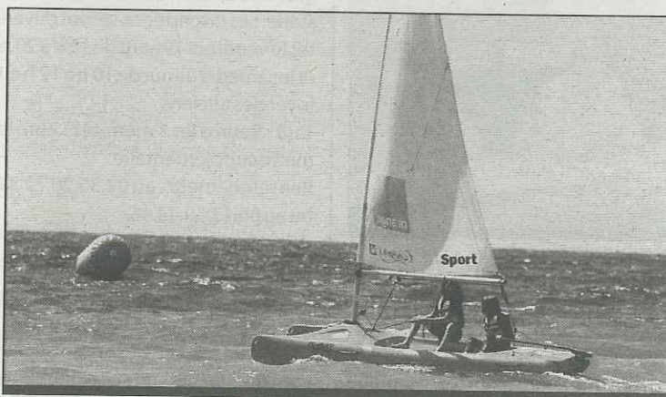
L'occasion de découvrir les plaisirs des sports nautiques

Une fois le pass-plage en main, il restera à réserver au pôle nautique (ouvert du mercredi au dimanche de 12 h 30 à 18 h 30, téléphone 02.35.13.96.00).