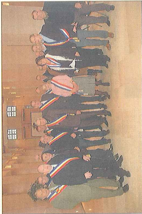
Les élus de Caux-Estuaire qui ne veulent pas entendre d'un quelconque périmètre avant d'entamer les discussions avec la CODAH et Criquetot ont suivi les débats lundi à la préfecture

Pour la gauche, la majorité présidentielle reste sourde à la volonté d'une majorité de maires de Caux-Estuaire et dénonce « un passage