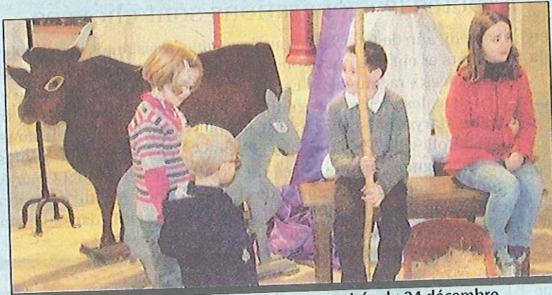
Les enfants ont beaucoup répété pour cette soirée du 24 décembre

21 e veillée de Noël avec crèche vivante et messe de Noël, aujourd'hui samedi 24 décembre à 18 h 30 au gymnase de Saint-Jouin-Bruneval.