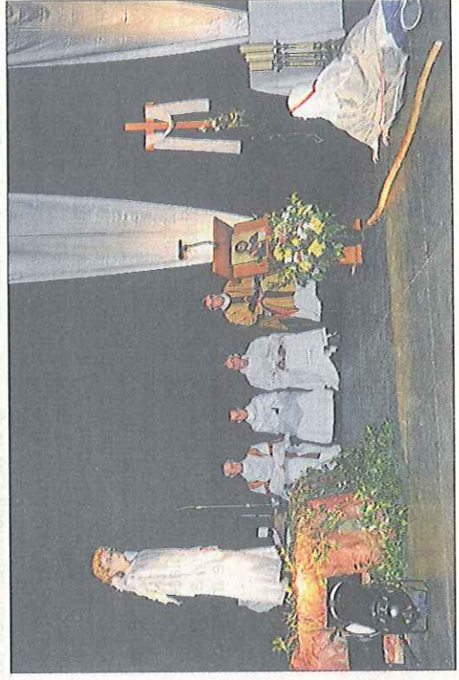
Scène de genre avec les enfants et au fond les abbés et l'évêque Brunin