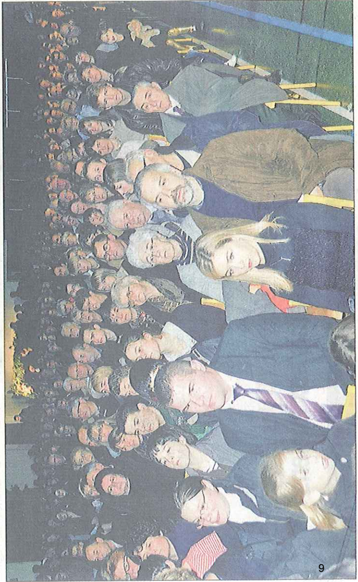
Les fidèles sont venus en très grand nombre lors de la 21 e messe de Saint-Jouin-Bruneval