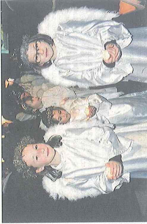
La procession des anges lors de la crèche vivante

Le nouvel évêque Brunin s'attache à découvrir la paroisse Saint-Gabriel-Cap-de-Caux. Il apprend également à rencontrer la communauté de Criquetot : « Je vais l'écouter, apprendre à vivre avec elle ». Nul doute que cette soirée de Noël lui aura appris beaucoup sur les uns et les autres.