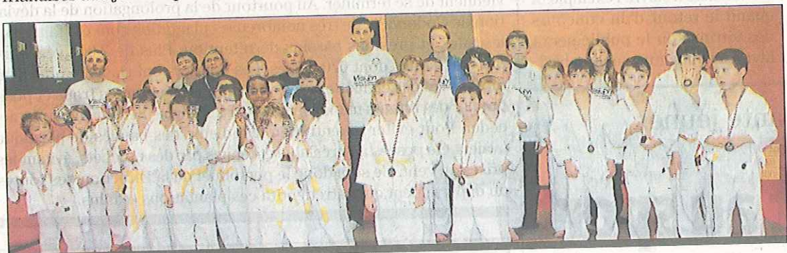
De jeunes judokas qui suivent les traces de leurs aînés