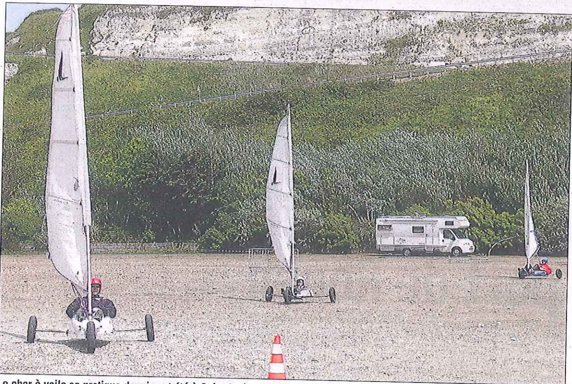
Le char à voile se pratique depuis cet été à Saint-Jouin

B eau temps ou gros temps, les touristes sont bien présents dans la région en ce mois de juillet.