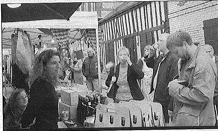
Ici ou là, une petite dégustation vous sera proposée

Renseignements auprès de Mme Dumont au 02.35.20.74.43