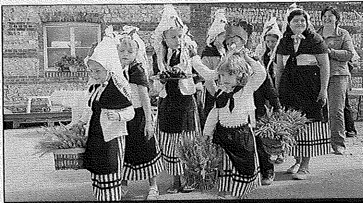
Les enfants revêtus du costume normand ont apporté les offrandes et le pain