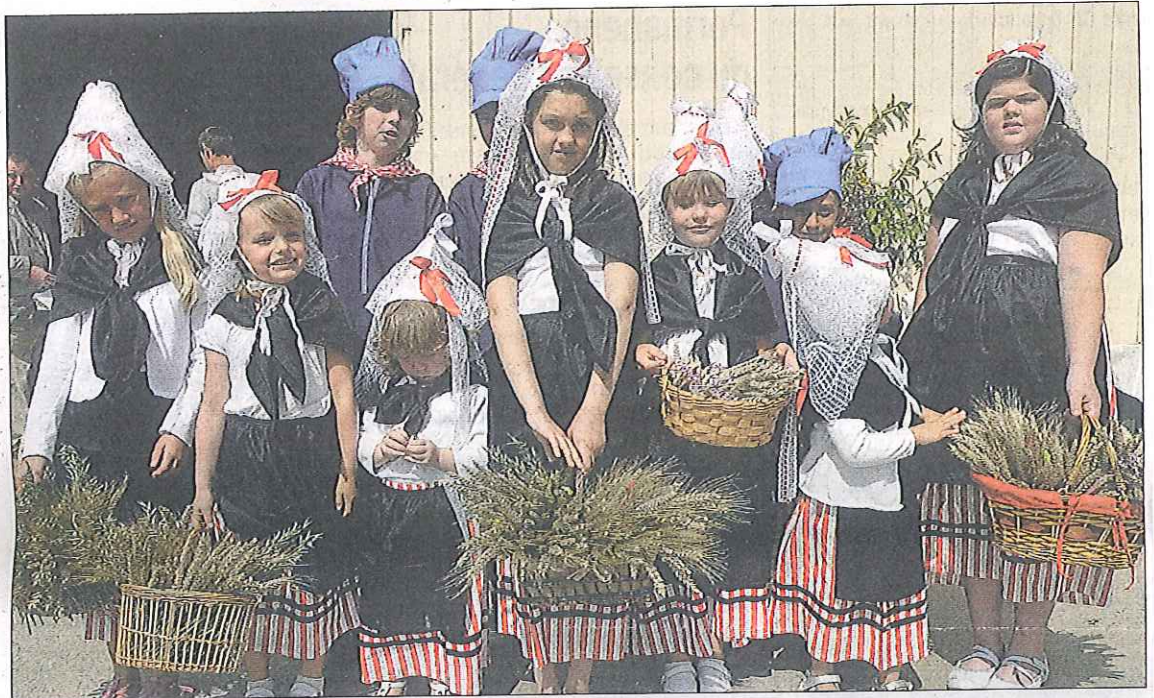
Les enfants de Saint-Jouin, avec ceux de Turretot, dans les costumes de la commune, paroisse d'origine qui a été intégrée en 1999 à Saint-Gabriel-Cap-de-Caux