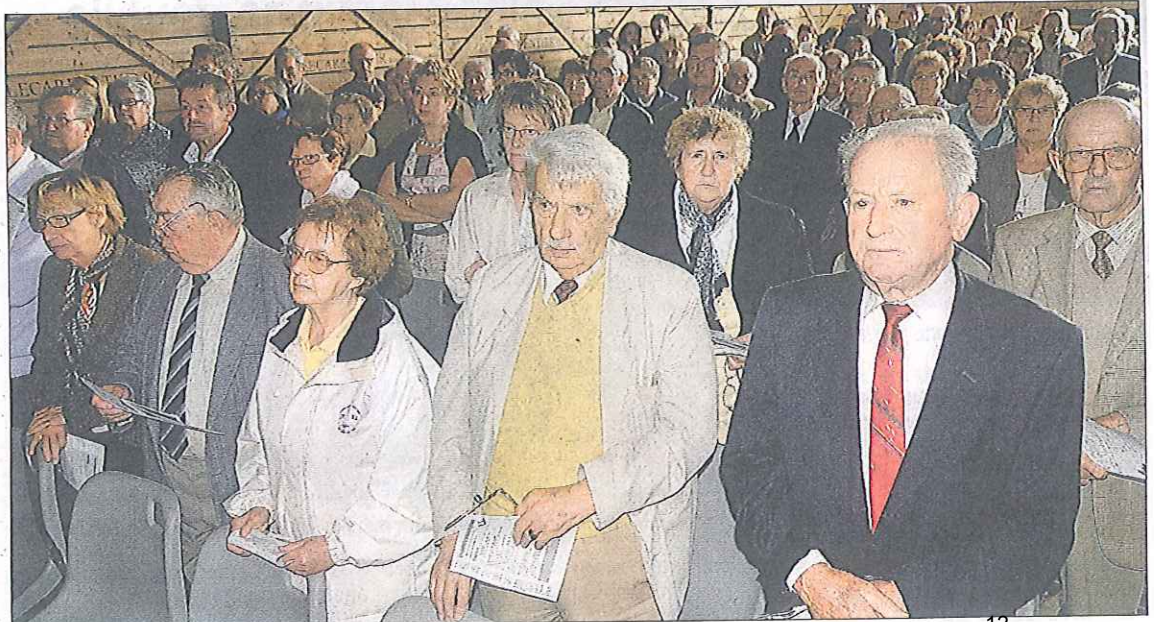
La fête de la moisson à la ferme Lecarpentier a connu une belle affluence