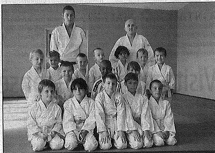
De jeunes judokas qui s'initient à cette discipline