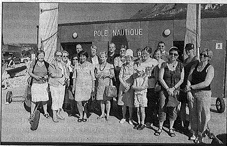
Un engagement commun pour ouvrir cette activité à tous

A noter, Saint-Jouin est une des rares plages de Seine-Maritime où l'on peut pratiquer ce sport, à marée basse sur le sable mais aussi sur un espace du parking à marée haute.