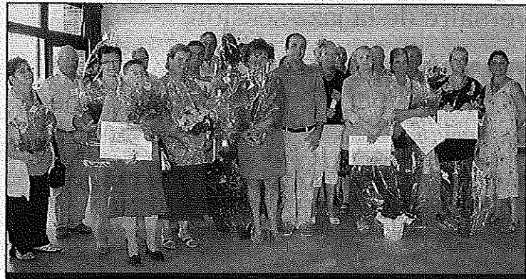
Les jardins reflètent souvent la personnalité de leurs propriétaires