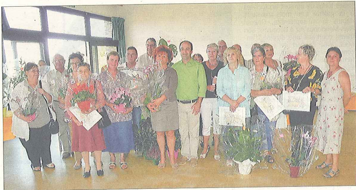
Les lauréats du concours 2011