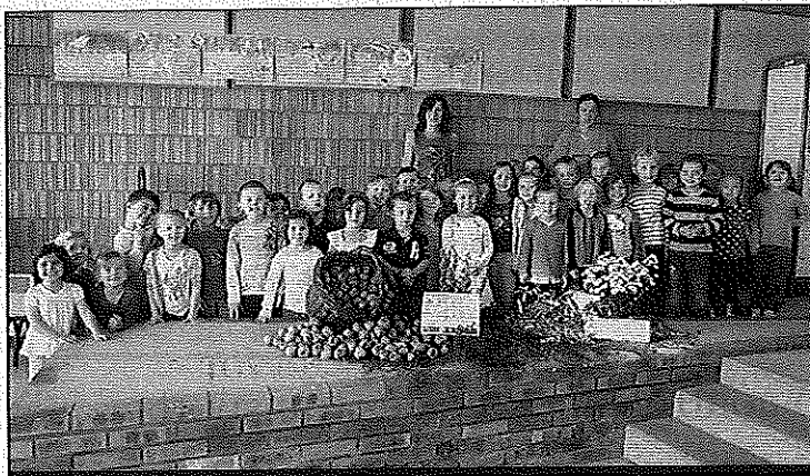
Les enfants sont sensibilisés à la nature

L es enfants de la maternelle ont goûté aux joies du jardinage. Des bambins qui ont la main verte puisqu'après avoir cueilli les bons légumes de leur potager, c'est une troisième place qu'ils ont récoltée au concours des écoles fleuries dans la catégorie « maternelle ». Et s'ils n'ont pu aller à la remise des récompenses à l'Hôtel du Département, c'est avec fierté qu'ils ont découvert leur diplôme assorti d'un bon d'achat d'une valeur de 120 euros qui servira à acheter des graines et des outils.